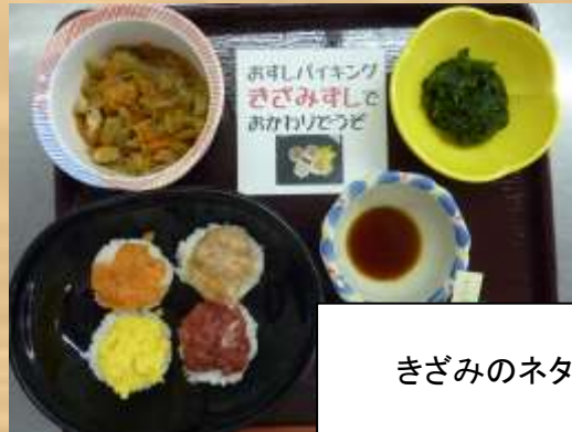
きざみのネタのすし

ST・現場・栄養で共通認識をし、 安全に摂取、お替りが配れるよう、 注意が必要な方に、カードを付けました