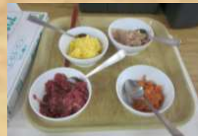
きざみのネタ お替り分